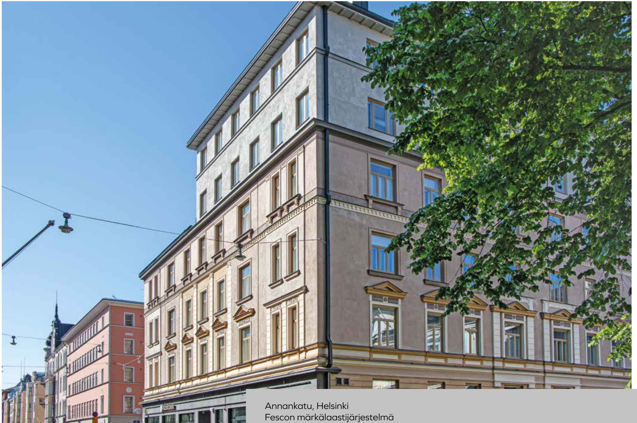
Annankatu, Helsinki Fescon märkäläästijärjestelmä