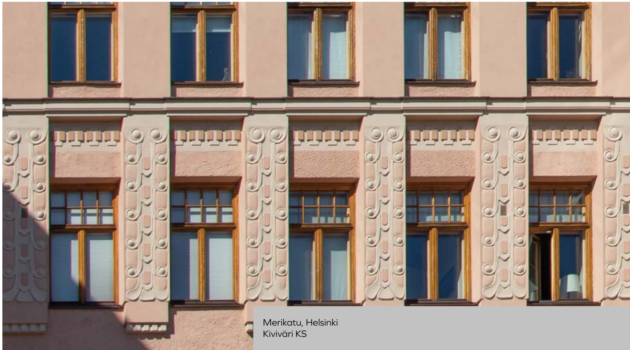
Merikatu, Helsinki Kiviväri KS